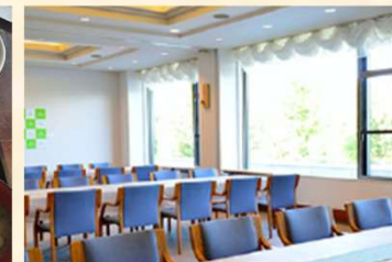
コンパルームも完備