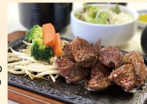
名物サイコロ ステーキ定食！