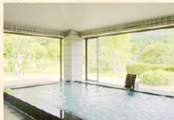
大浴場は由布院の天然温泉！