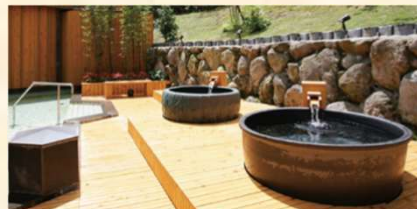
無色透明でなめらかな肌ざわりの 天然温泉