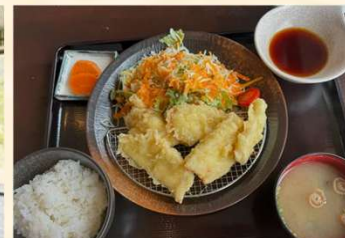
レストランの名物 とり天定食！